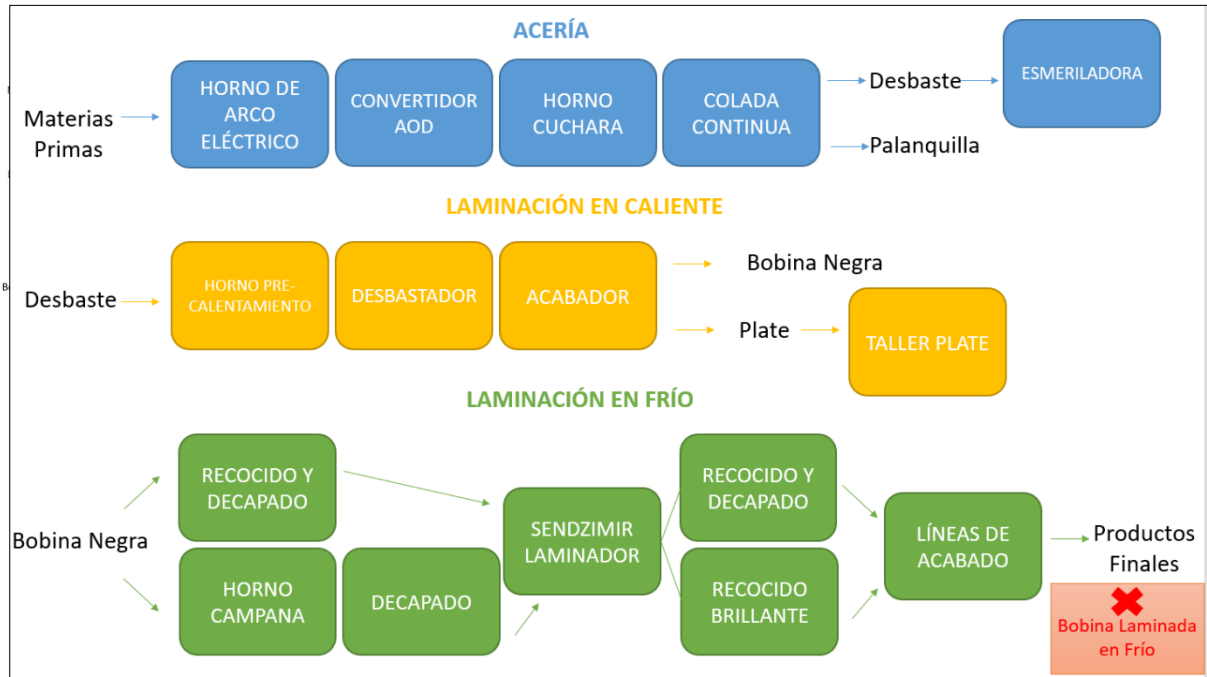
Figura 2: Proceso de laminación en frío.